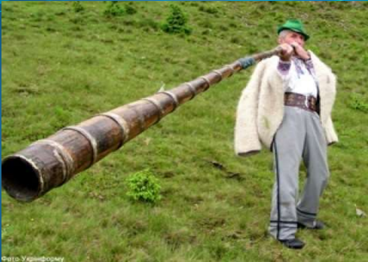
СИГНАЛЬНАЯ ТРУБА - ТРЕМБИТА